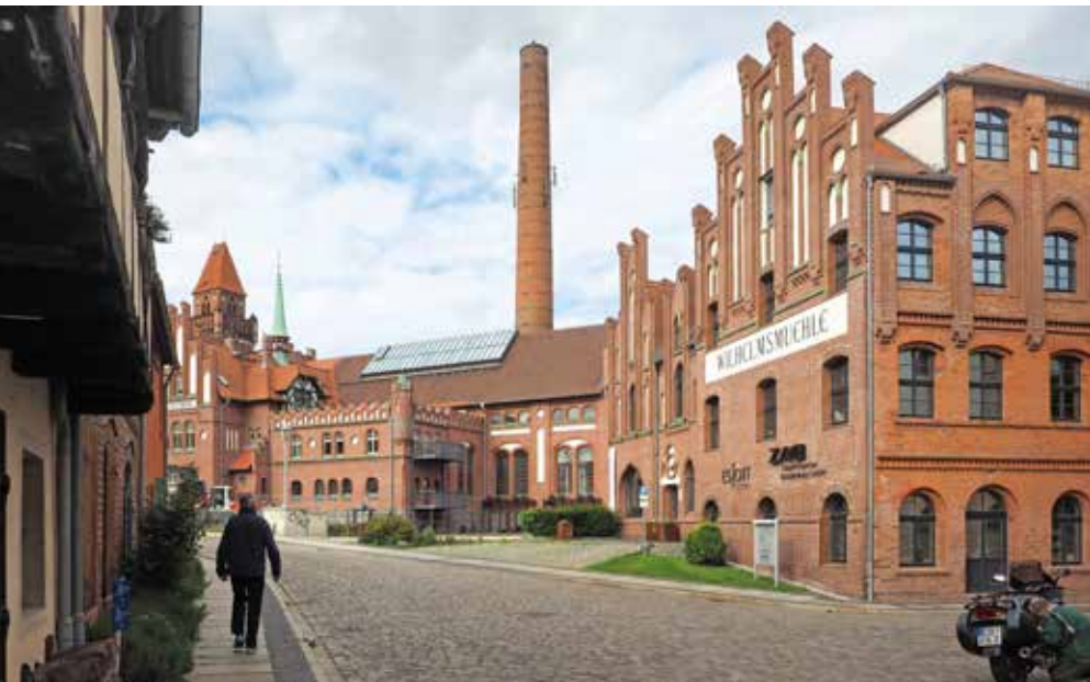
Cottbus: de oude elektriciteitscentrale in expressionistische stijl, nu Kunstmuseum.

stadje in badjas het huis uit om een duik in het meer te maken. De Katharinagraben, gevoerd door de Schlaubebeek, is er een romantisch plekje. Vóór de Schlaube in het Oder-Spree-kanaal stroomt, geeft ze nog vorm aan de Großer Müllroser See. We worden er attent op gemaakt dat 'Müllrose' niets met 'Müller' (molenaar) noch met 'Rose' te maken heeft, maar afgeleid is van een Sorbische eigenaam. Een stadswandeling laat je verder kennismaken met het historische marktplein, de Müllroser-molens uit 1275 en een heimatmuseum in het Haus des Gastes.