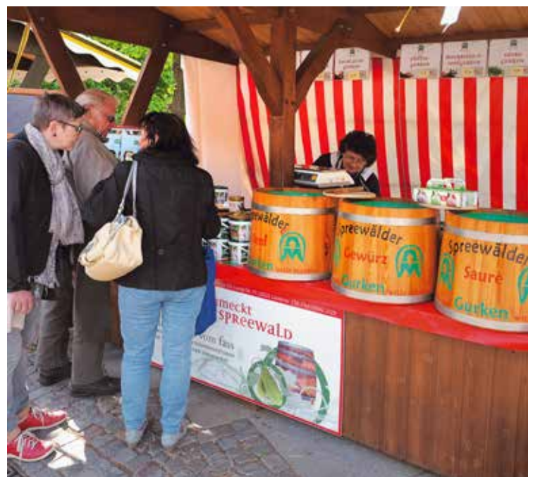
Spreewald laat zich kennen als 'Gurkenstreek' (augurken) bij uitstek. Zoet of zuur, gezouten of gepeperd, proeven moet je.