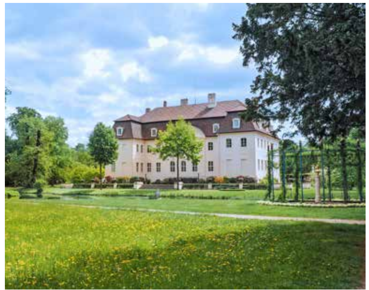
Slot Branitz in een groots landschapspark van Hermann Fürst von Pückler-Muskau, in Cottbus, de groene stad aan de Spree.