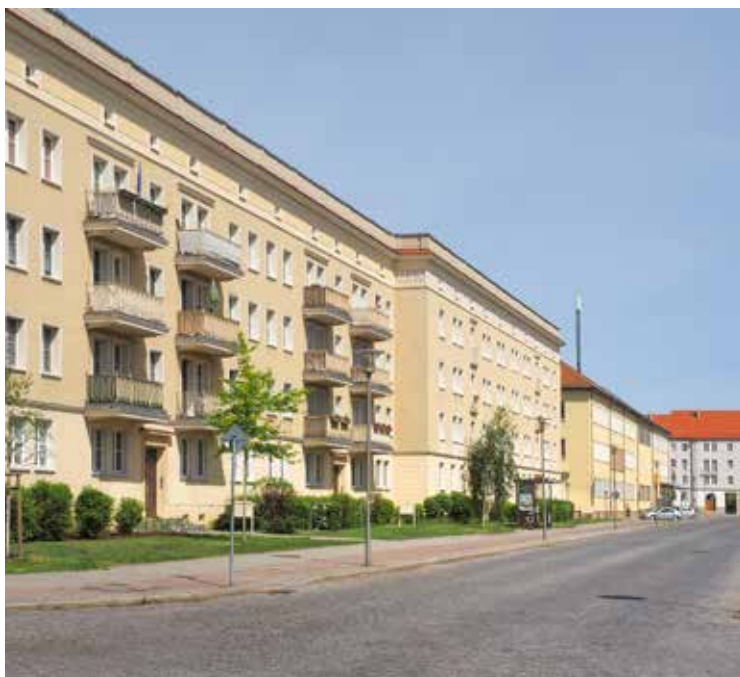
Eisenhüttenstadt verbaast door zijn straklijnige woonkwartieren waar kwaliteitsvol leven mogelijk is.