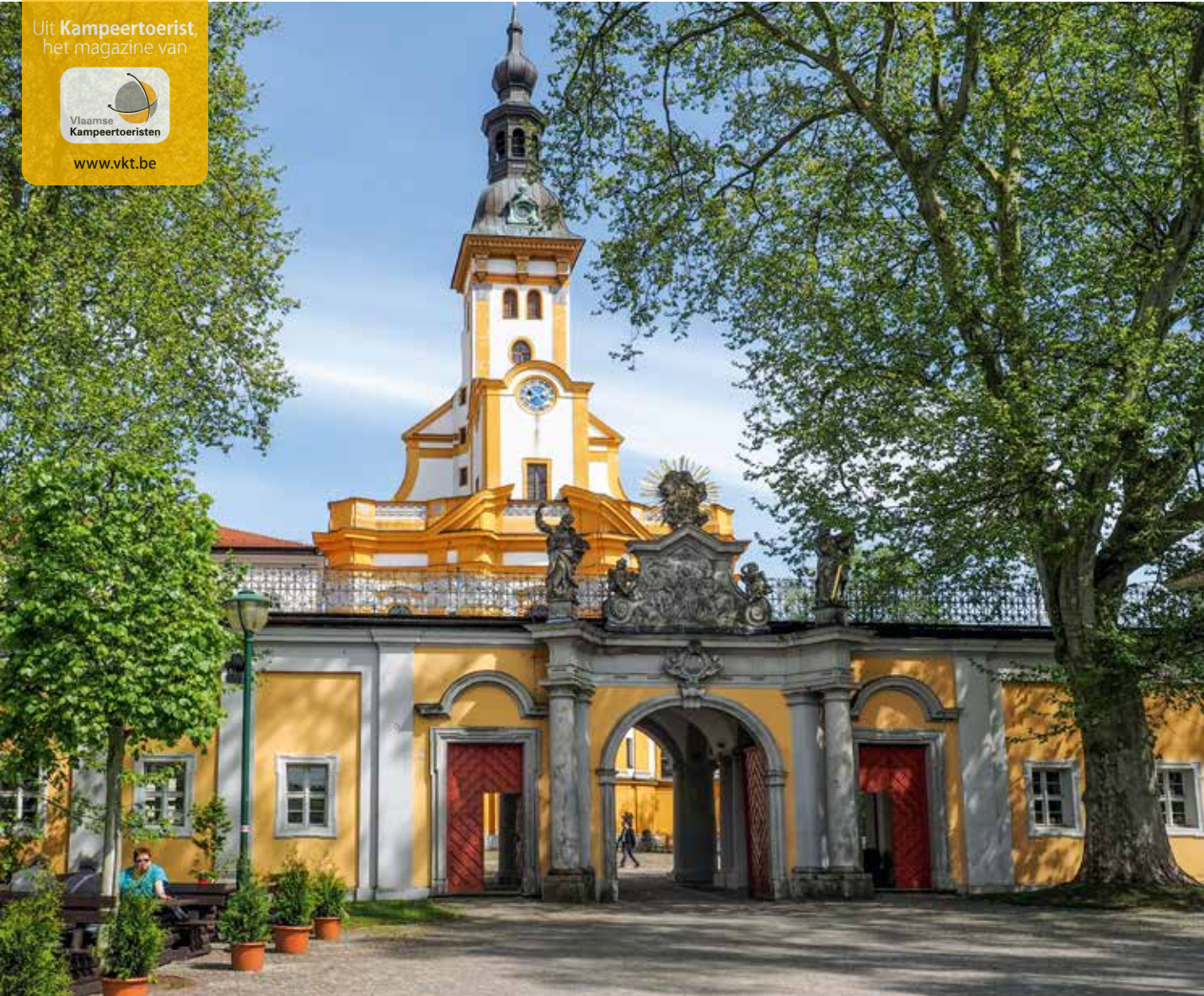
Kloster Neuzelle, gesticht in de 13de eeuw, werd in de 17de eeuw rijkelijk met barokelementen opgesmukt.