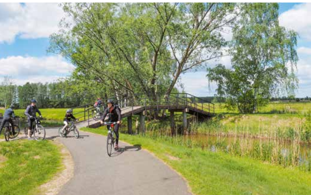
Lekker fietsen op de Gurkenradweg in Spreewald.

Toen na de Tweede Wereldoorlog de deling van Duitsland een feit was, had de DDR geen staalindustrie meer. De nieuwe republiek was voor kolen en ijzererts aangewezen op Polen en de toenmalige Sovjet-Unie. Daarom werd aan de grens een reeks ijzersmelterijen opgezet. In een gebied waar tot 1950 enkel woud was, werd meer dan drie miljoen m 2 bos gerooid. Eerst kwamen er ijzersmelterijen ('Eisenhütten'). Daarna werd voor de arbeiders een woonstad uit de grond gestampt die een socialistische modelstad moest zijn, de eerste (en enige) in de DDR. Het werd Stalinstadt. Nadat in 1961 Stalin in ongenade was gevallen, werd het Eisenhüttenstadt. De oppervlakte werd opgedeeld in grote vierkanten met aan de rand woonblokken drie tot vier verdiepingen hoog en in het midden een groene ruimte, een speelplein voor kinderen en een fontein voor de watervoorziening. Het Dokumentationszentrum Alltagskultur der DDR in een voormalige