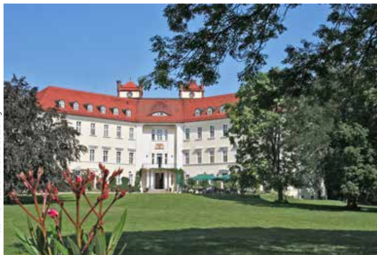
Het majestatische 'Schloss' in Lübbenau.

Links van Cottbus pikken we nog de Slawenburg Raddusch mee. De bruinkoolontginning in de streek bracht vele vondsten aan het licht, waarmee de geschiedenis van de regio grotendeels kon gereconstrueerd worden. Sporen van menselijke aanwezigheid gaan tot 12.000 jaar terug. Slavische volksstammen die hier vanaf de 6de eeuw binnenkwamen bouwden cirkelvormige vestingen ter verdediging tegen de Germaanse dreiging. Recentelijk werd hier een dergelijke burcht getrouwd en volgens maatstaf 1/1 gereconstrueerd: 38 m in doorsnee met een grondoppervlakte van 1.000 m 2 . In de 10 m brede ommuring, oorspronkelijk uit houten palen, leem en zand, is een museum ondergebracht dat op een instructieve manier laat zien hoe en met welke werktuigen men in die tijd aan de slag ging. Een mooi eerbetoon aan de Sorbische cultuur en tradities in een streek waar het water de hoofdrolspeler is. ■