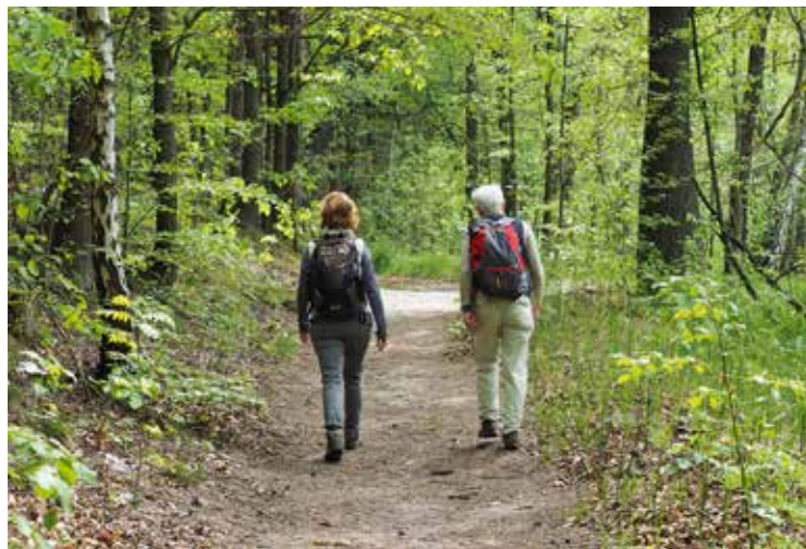
De 25 km lange Qualitäts-Schlaubetal-Wandelweg, van Müllrose tot de Wirschensee, wordt wel eens de mooiste van Brandenburg genoemd.