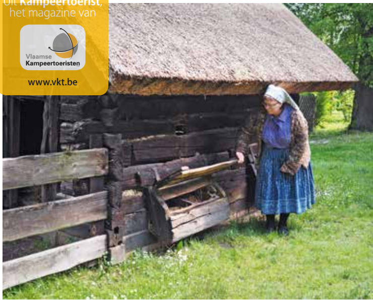
In Spreewald slaagden de Sorben erin hun cultuur en tradities levend te houden.