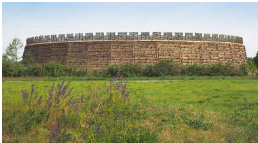
De indrukwekkende Slawenburg Raddusch, bij Cottbus, heeft een 10 m brede ommuring.