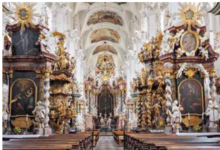
In de Sankt Marienkirche (Kloster Neuzelle) vertellen plafondfresco's het bijbelverhaal, in een triomferend barokke stijl.