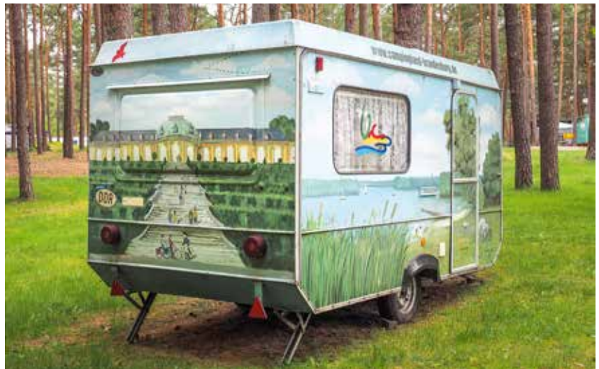
Welkom op Familiecamping Schervenzsee.

Wat Müllrose is voor het Schlaubetal, is Lübbenau voor Spreewald. Onze schipper is een stoere dame die ons als een volleerde gondelierster geruisloos door het 'Fließenlabyrinth' loodst. "Kopf einziehen!" roept ze ons toe telkens we onder een laag brugje door moeten. We glijden over het water, een kuur in onthaasting. Zo komen we voorbij het typische Spreewalddorp Lehde dat volledig onder monumentenzorg staat. Tot 1929 enkel over het water bereikbaar. Een openluchtmuseum (Freilandmuseum) laat ons de leef- en wooncultuur en de aloude tradities van de Sorbische bevolking zien. Lübbenau zelf verdient een bezoek. Een gezellige stad met verkeersvrije straten en verschillende haventjes. De stadskerk Sankt Nikolai is in Dresdner barok uitgevoerd. Onze wandeling gaat via de Fischerstraße, langs de Hauptspree en Wirtschaftsweg, richting Schlossgarten. De slotvijver levert schilderachtige hoekjes op. In het slot of op het terras kan je genieten van een traditionele keuken tegen een eenvoudige prijs. Je voelt je even kasteelheer of -dame in een uniek decor.