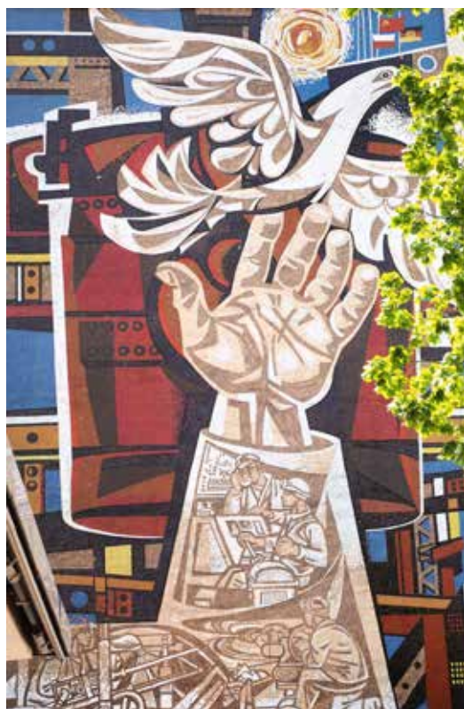
Eisenhüttenstadt wil een vredeboodschap uitdragen zoals blijkt uit deze muurschildering.

'Kindergarten' (crèche) laat zien hoe het er in het dagelijkse leven concreet aan toe ging. Na de Wende in 1989 werd een groots restauratie- en renovatieplan uitgewerkt, wat van Eisenhüttenstadt een attractieve stad heeft gemaakt waar het gezellig wonen is en een bezoek zeker waard. Aan het concept van de stad werd niet geraakt. Verschillende woonblokken staan onder monumentenzorg ('Denkmalschutz'). Eén belangrijk verschil: de mensen leven er in vrijheid. De ijzer- en staalfabriek hoort nu bij het staalconcern ArcelorMittal, terwijl verschillende andere industrieën er een stek hebben gevonden.