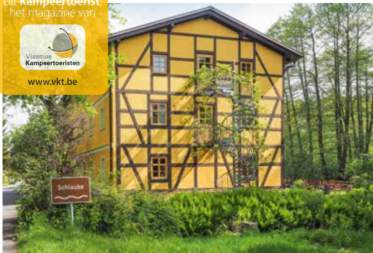
De Keizermolen in Müllrose, in het liefelijke Schlaubetal.