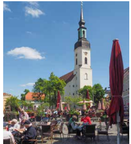
Het marktplein in Lübbenau, trefpunt bij uitstek.