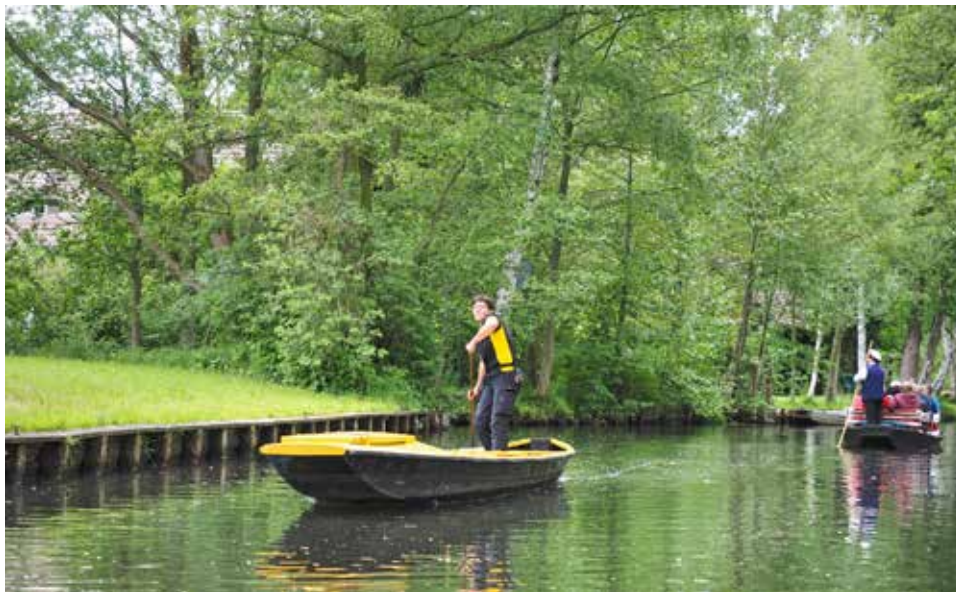
In Spreewald wordt de post per 'Kahn' gebracht, een platte schuit die met een lange stok wordt voortgeduwd.